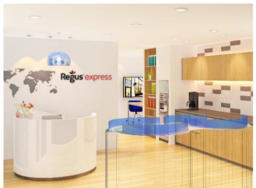
リージャスエクスプレス阪急茨木市駅のエントランスイメージ