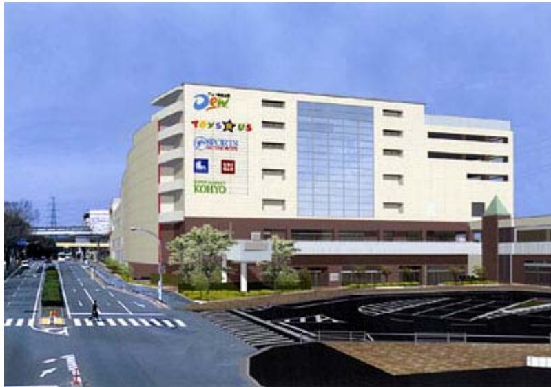
「外観イメージパース」