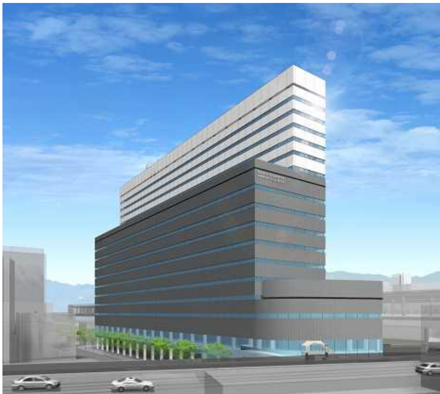
外観イメージパース（ビルを北西方向より望む）