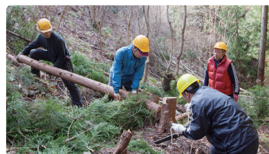
従業員ボランティアによる間伐作業(能勢妙見山)