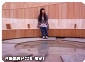
冷風体験ができる「風室」