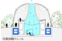
冷風体験のしくみ

「風室」では、電気などの動力を一切使用せず、六甲山に吹く風を利用して自然換気が行われています。夏季には、冬に採取した天然氷を貯蔵する「氷室」を通して冷却した風を、「風の椅子」に座って体感できます。