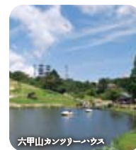
六甲山カンツリーハウス

六甲枝垂れのほかにも、大芝生など自然を生かした遊び場がいっぱいの六甲山カンツリーハウス、木々に囲まれ汗を流せる六甲山フィールド・アスレチック、珍しい高山植物、寒冷地植物が観察できる六甲高山植物園など、六甲山には自然と触れあえるスポットが満載です。