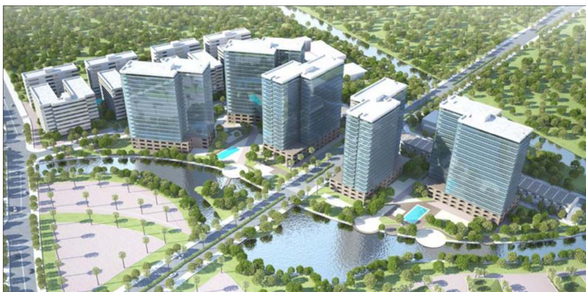
※「MIZUKI PARK (第1期)」のイメージパース