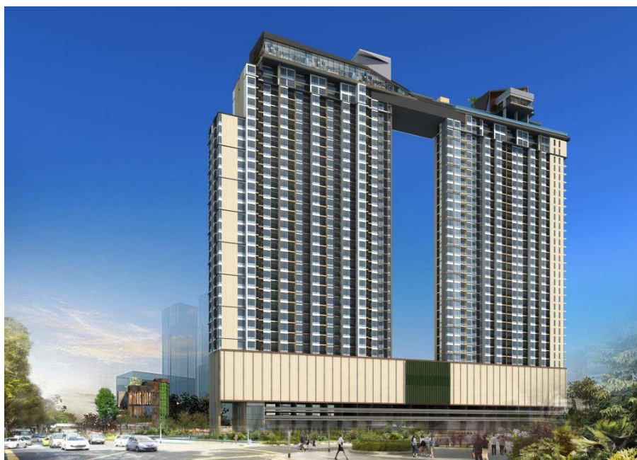
※『(仮称)Ekamai(エカマイ) プロジェクト』のイメージパース