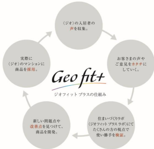
＜「ジオフィットプラス」プロジェクト概念図＞