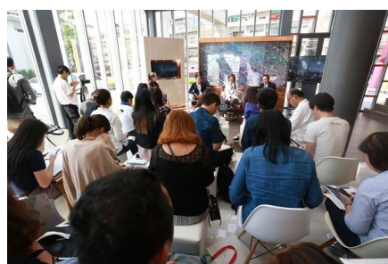
※メディア向けプロジェクト発表会の様子