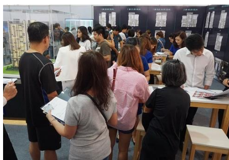
※販売イベントの様子