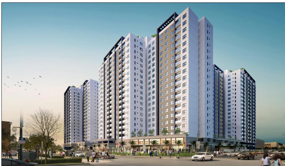
※「AKARI CITY (第1期)」のイメージパース