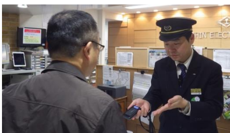
(翻訳専用端末を使ってお客様の案内を行う駅係員の様子)

■特徴：音声認識技術による翻訳文をタブレットや端末画面に表示し、更に機械音声で文章を読み上げます。日本語、英語、中国語、韓国語に対応しています。