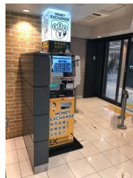
(神戸三宮駅西改札側に設置している外貨両替機)

■両替機の特徴：10か国語によるモニター表示及び日本語と英語による音声ガイダンス機能があります。