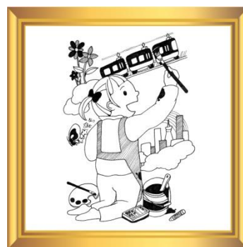
甲子園駅長賞「画家」