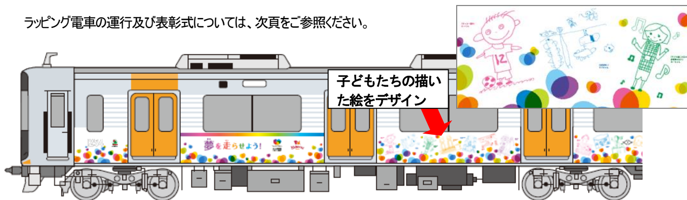
【ラッピング電車 デザイン】