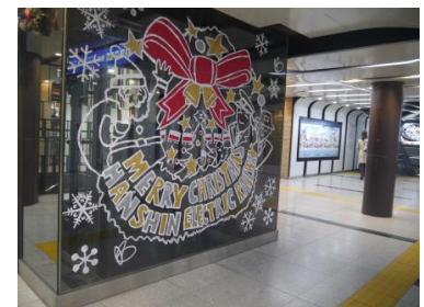
<神戸三宮駅の装飾（昨年）>