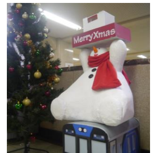
<梅田駅のスノーマン（昨年）>