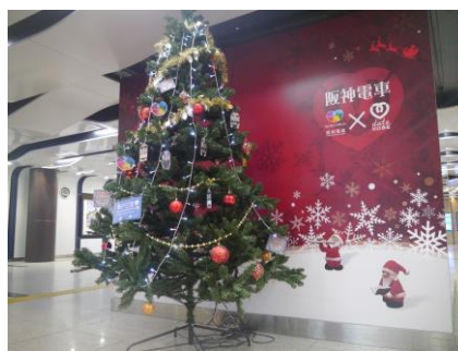
<EVガラス面への装飾(昨年作品)>