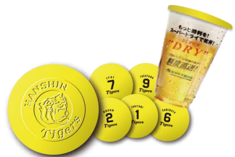
▲オリジナル ビアカップ カバー デザイン(イメージ)