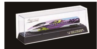
500 TYPE EVA オリジナルNゲージ