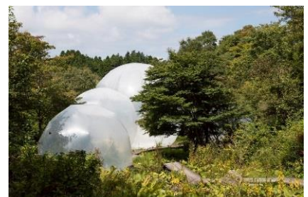
奥中草人《Inter-world-sway》 2017年 六甲オルゴールミュージアム