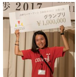
昨年受賞時の様子

※最新情報については、決まり次第、随時webサイト( http://www.rokkosan.com )で発表します。