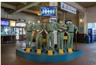
明和電機《ひっぱれ! 六甲ケーブルカー》 2017年 六甲ケーブル

六甲山のエリア特性をじっくりと読み込み、自然や景観、歴史を採り入れた作品を各会場に展示します。