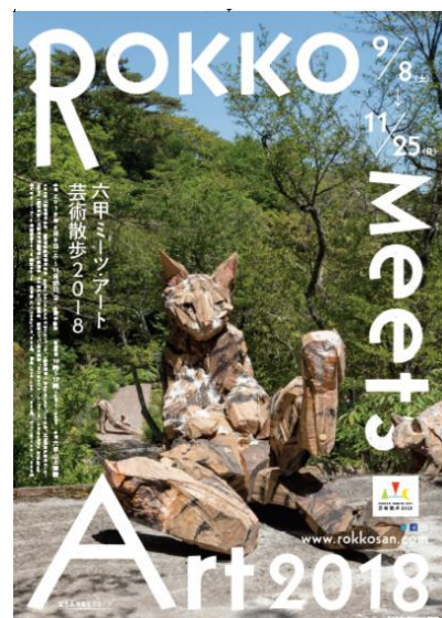
[六甲ミーツ・アート 芸術散歩 2018] 花田千絵「ほどけるととき」六甲オルゴールミュージアム 参考:ポスターデザイン