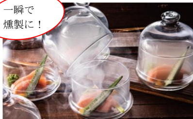
瞬間スモークサーモン 柑橘風味のソース