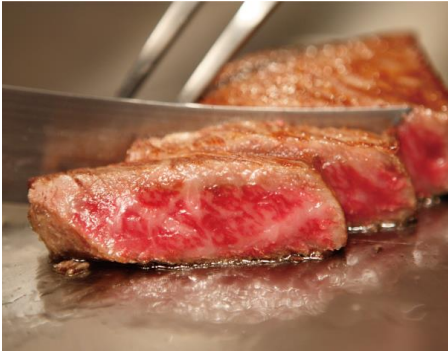
牛フィレ肉のステーキ 夏野菜添え バーベキューソース