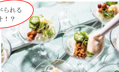
エスプーマ仕立ての冷やし素麺