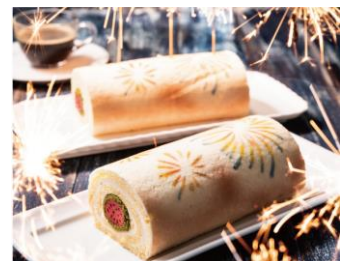
はじける！！花火ロール

※表記の料金にはいずれも消費税・サービス料10%が含まれます。※画像は全てイメージです。