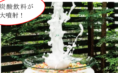
たまでとどけ！大噴射フルーツポンチ