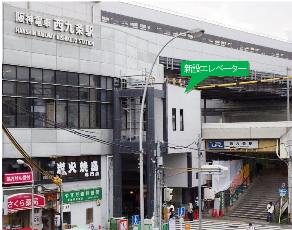
新設エレベーター（写真中央）