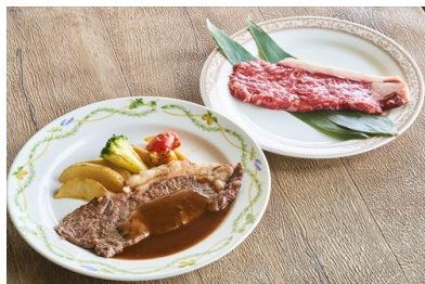
「国産 サーロインステーキ」