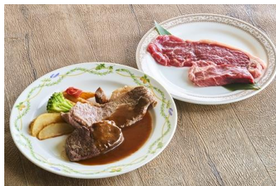
「米国産 サーロインステーキ&