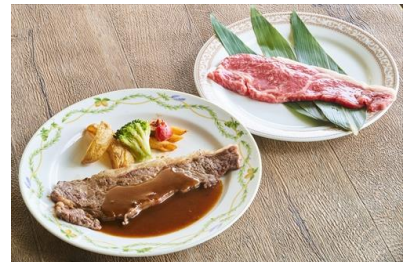
「兵庫県 淡路島産 サーロインステーキ」