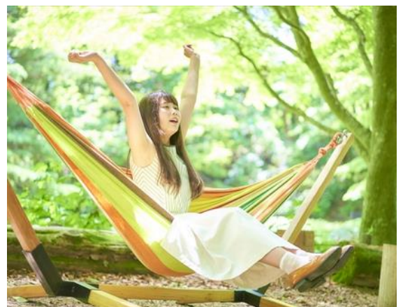
六甲高山植物園 「ブナカフェ」イメージ

【メニュー】 日替わりハーブティー 300円 神戸ウォーターレモネード 330円 やまみつグラノーラバー 480円 コーヒー 300円 他