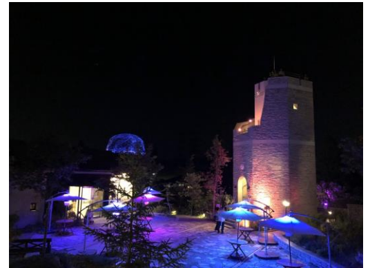
六甲ガーデンテラス 「Summer Lighting Night Cafe」イメージ

【料金】 エリア内入場無料 ※雨天中止 ※ライティングは8月中毎日開催 ※テイクアウト営業時のカフェエリアはテイクアウトメニュー購入者のみ利用可