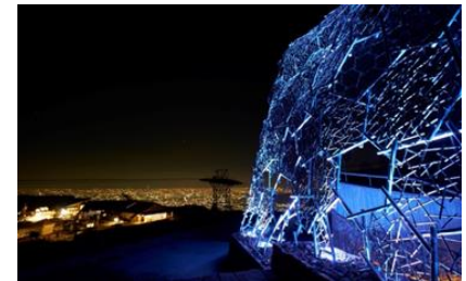
自然体感展望台 六甲枝垂れ(イメージ)