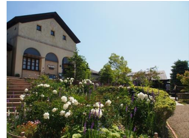
六甲ガーデンテラス(イメージ)

【営業時間】 平日 9:30～21:00 土・日・祝 9:30～22:00 ※季節、店舗、天候、曜日により異なる。