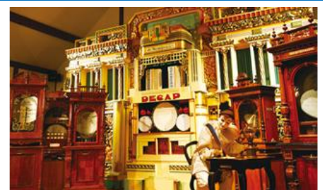
六甲オルゴールミュージアム(イメージ)