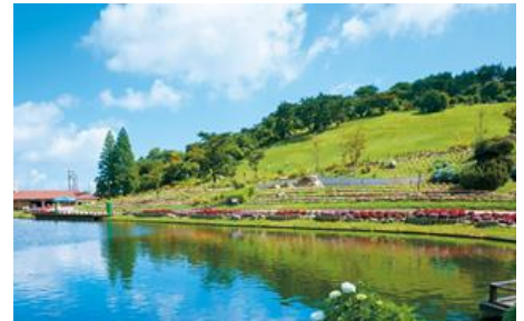
六甲山カンツリーハウス(イメージ)