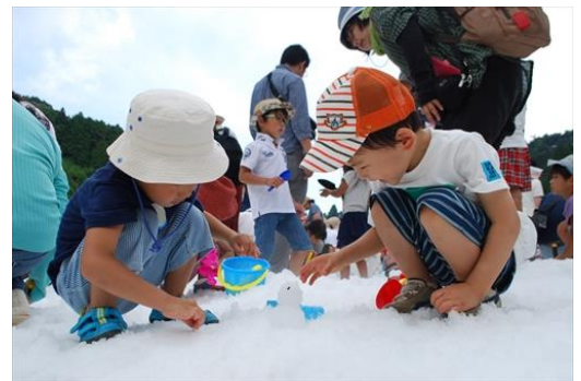
六甲山カンツリーハウス 「真夏の雪まつり」イメージ