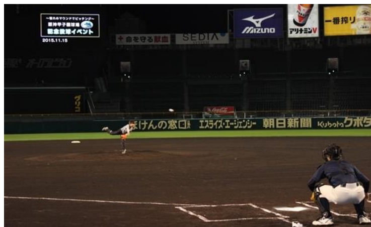
ナイターマウンド投球の様子