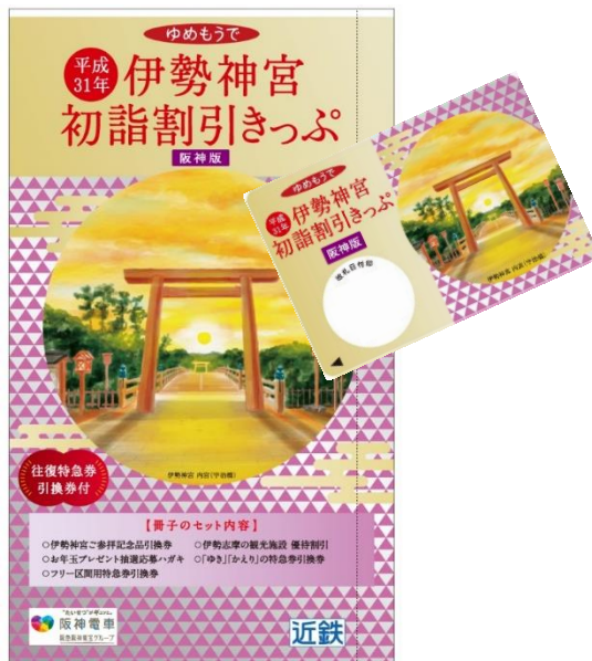
阪神版「伊勢神宮初詣割引きっぷ」

これらの便利でお得な初詣きっぷで、伊勢神宮や阪神・近鉄沿線の初詣・初旅にぜひお出掛けください。