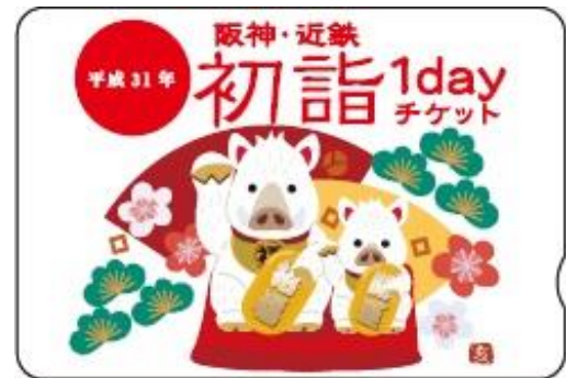
「阪神・近鉄 初詣 1day チケット」