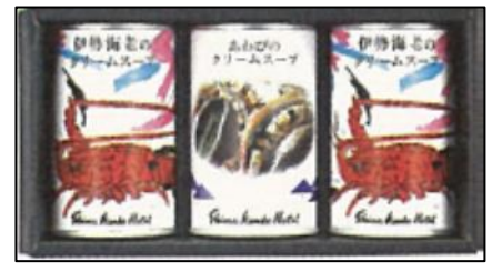
「志摩観光ホテル伊勢海老のクリームスープ&あわびクリームスープセット」