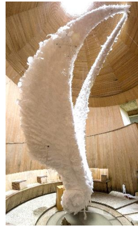
松蔭中学校・高等学校美術部 「がんばれ! てんしろくん!」