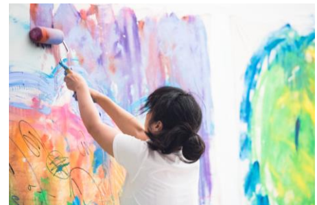
ライブペインティング イメージ