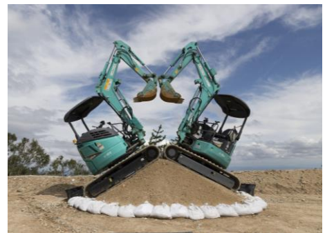
大木土木とミツヤ電機 おしゃまなユンボワークショップ『土ホイメクラ』