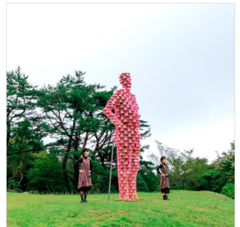
六甲ミーツ・アート 芸術散歩 2018 開催イメージ