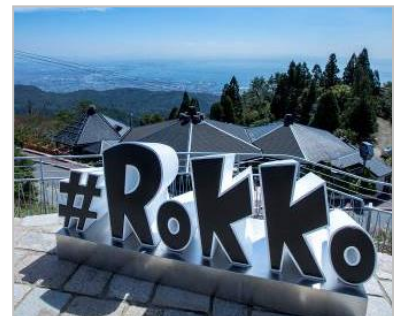
佐川好弘「#ROKKO」2018年 自然体感展望台 六甲枝垂れ