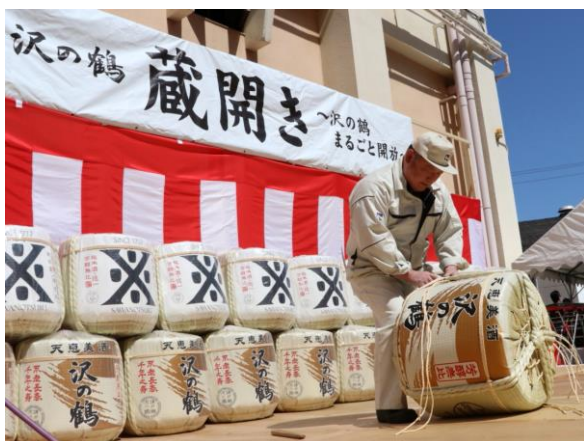
樽菰巻き実演の様子（沢の鶴）