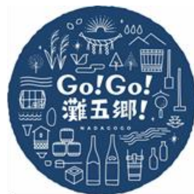
「灘の酒蔵」活性化プロジェクト シンボルマーク（ロゴ）