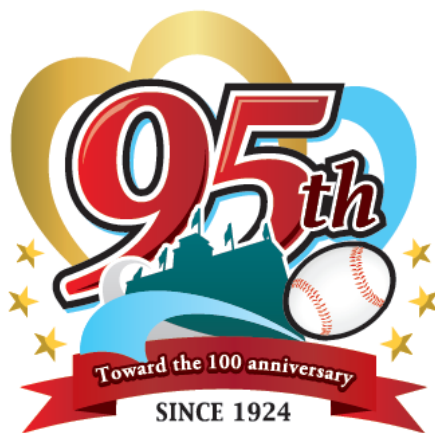
【阪神甲子園球場 95 周年記念ロゴ】

95 周年記念ロゴには、95 年分のお客さまへの感謝の気持ちと、100 周年に向けて、阪神甲子園球場の歴史とその魅力を、色褪せることなく発信し続けていくという想いを込めました。