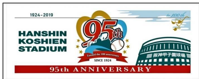
95周年記念フェイスタオル

<URL> http://www.hanshin.co.jp/koshien/95th/event/