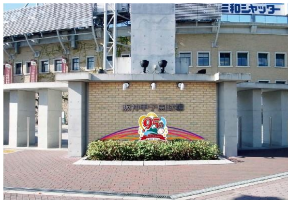
【野球塔裏(レフト外野席外周)】