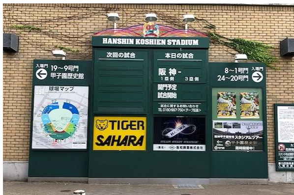
【球場正面对戦カード看板】