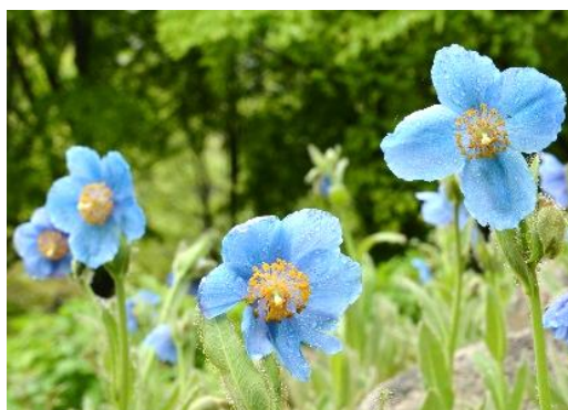
ヒマラヤの青いケシ