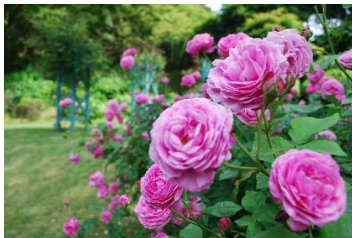
六甲山カンツリーハウス ローズウオーク