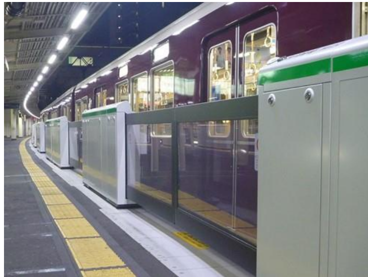
可動式ホーム柵(十三駅5号線)