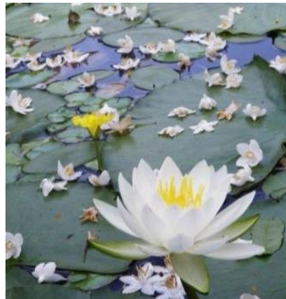
六甲オルゴールミュージアム スイレン