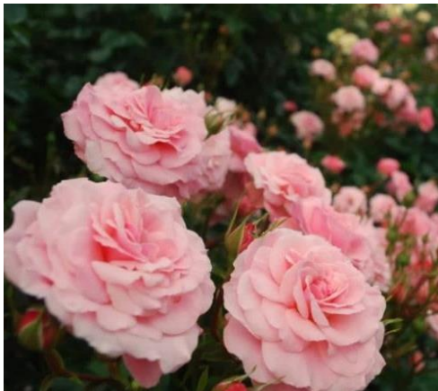
六甲山カンツリーハウス ローズウオーク

六甲山の花のベストシーズンを、多くのお客様にお楽しみいただくため、チケット1枚で六甲山上の有料4施設をお得に周遊できる「神戸 六甲山花めぐりチケット」を7月31日(水)まで販売しています。