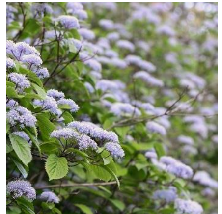
六甲高山植物園 コアジサイ