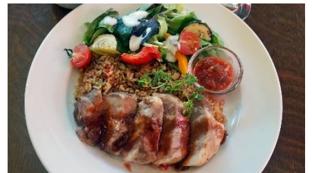
グリルポーク・オーバーライス(イメージ)