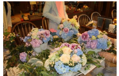
フラワーアレンジメントの様子(イメージ)