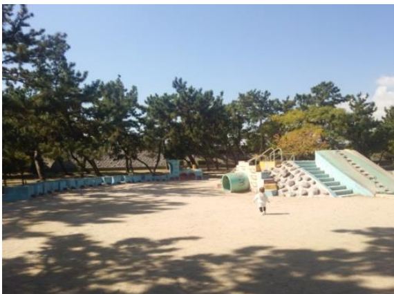
〈浜甲子園運動公園（西宮市）〉