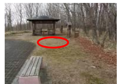
サテライト展望台 丸印か設置場所