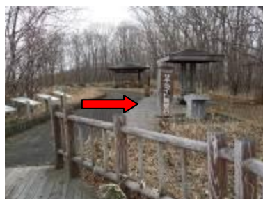
サテライト展望台 矢印か設置場所