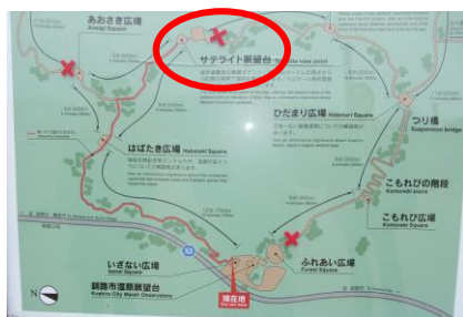
釧路湿原遊歩道 地図看板 丸印か設置場所