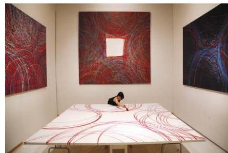
第 22 回岡本太郎現代芸術賞展