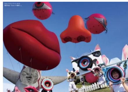
「おおさか福笑い」+「六甲ハイ・チーズ」