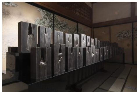
「エンドタブ」高野山開創 1200 年特別企画展 「いのちの交響」高野山総本山金剛峯寺(奥殿) 2015年 撮影:阪田隆治 ©Chu Enoki