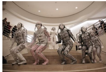
ケイタイガールマーチング in Paris 2008 年

< 資料に関するお問い合わせ先 > 六甲ミーツ・アート 芸術散歩 2019 事務局