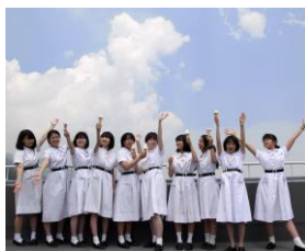
松蔭中学校・高等学校美術部