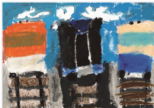
なんば しほ 難波 志帆さんの作品