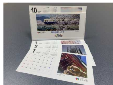
阪神沿線カレンダー 2019年版