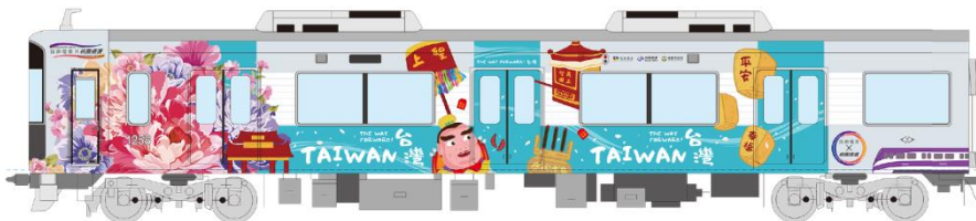
<ラッピング列車の外観>