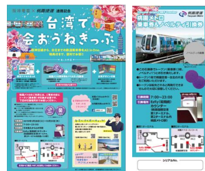
<きっぷ台紙およびパウチャー券>

2019年5月28日(火)～2019年9月30日(月)の期間で、阪神電車各駅(神戸高速線を除く)から大阪難波駅と南海電鉄の難波駅から関西空港駅までの片道乗車券および桃園メトロ線の空港駅～台北駅間の往復乗車券、桃園メトロ、台湾グッズをセットで発売しました。(発売終了)