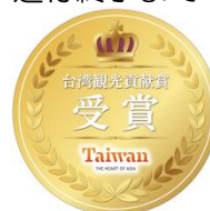
<受賞記念ステッカー>