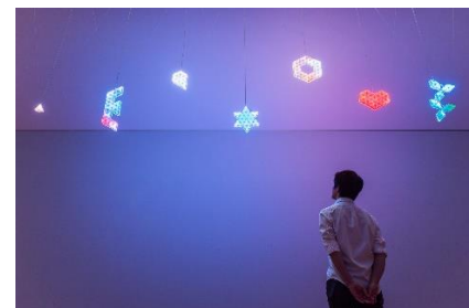
「ひかりのミナモ」2014年 「じぶんのまわり 一耳でながめて 目でかいで 鼻でふれて 手できいて」展 茅ヶ崎市美術館