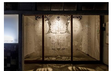
「信仰」2019年 HAPS オフィス 1F