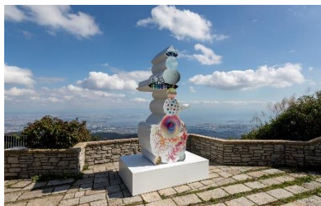
植松琢磨《world tree II》 2019年 六甲ガーデンテラス

六甲山のエリア特性をじっくりと読み込み、自然や景観、歴史を採り入れた作品を各会場に展示します。