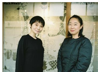
谷澤紗和子 × 藤野可織