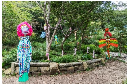
秦まりの《MAHOU NO MORI》 2019年 六甲オルゴールミュージアム