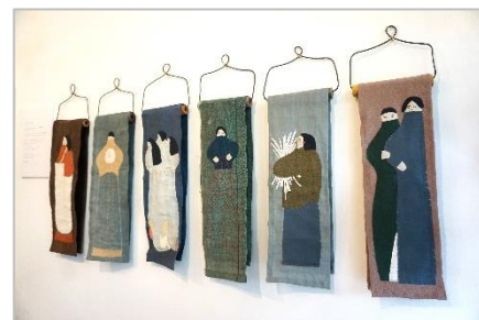
2020年 2人展「小さじ、すりきり一杯」 doremifa / 東京