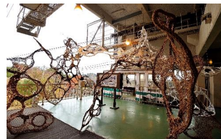
「あみつなぎ六甲」六甲ミーツ・アート 芸術散歩 2015 (六甲有馬ロープウェイ六甲山頂駅)