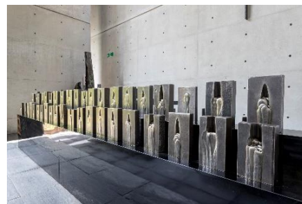
榎忠《End Tab (エンドタブ)》 2019年 風の教会