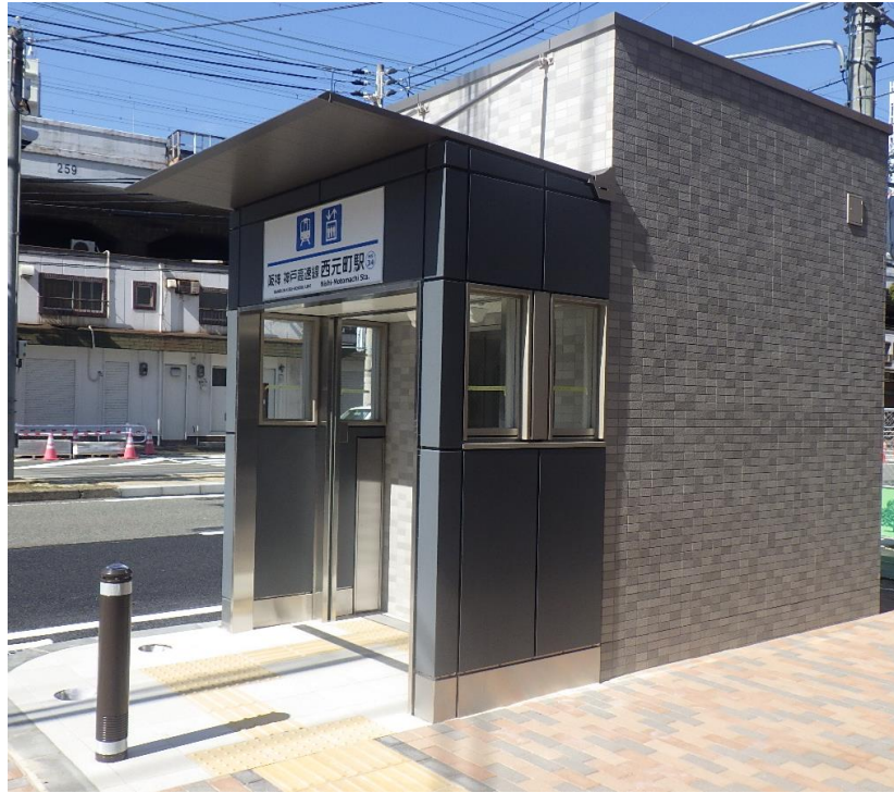
新設エレベーター（地上の外観）