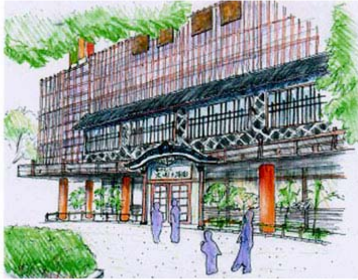
温浴施設「有馬温泉 太間の湯」エントランス外観 完成イメージパース