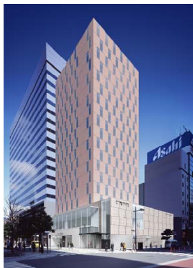
<レム日比谷外観イメージ>