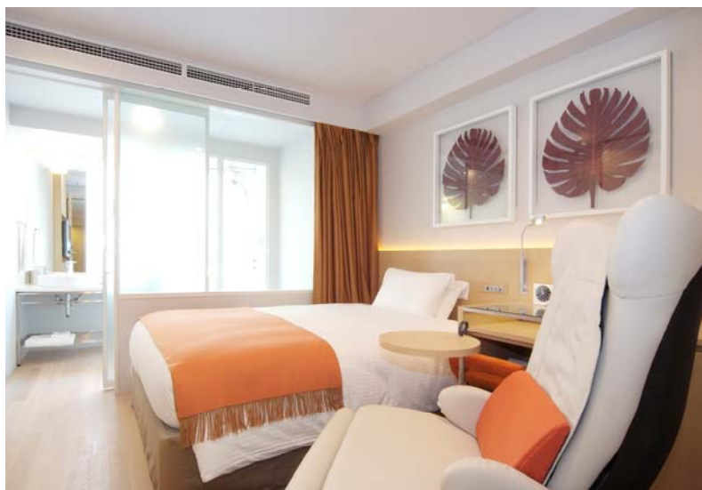
<客室イメージ (シングル) >