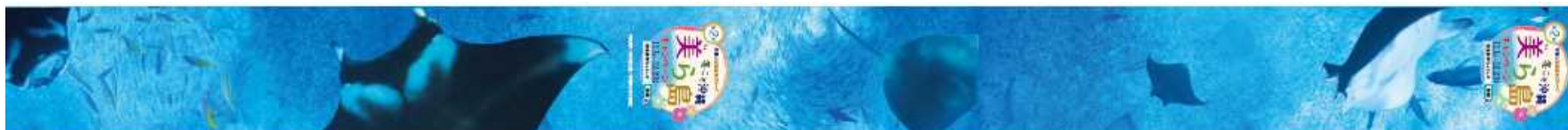
2. 宮古島車両 / 5. 「恋の島、沖縄」・「親子孫たび」車両