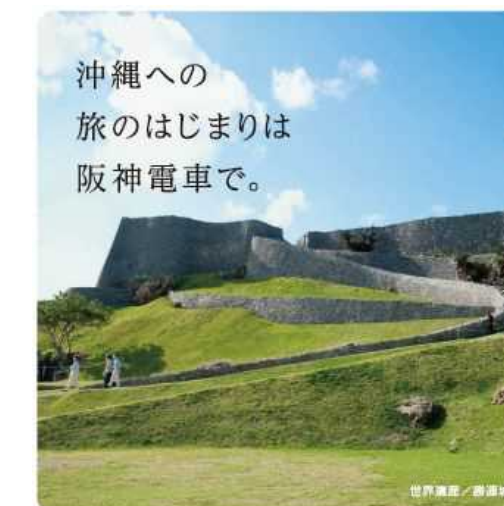
6. 「大人のふたり旅」車両