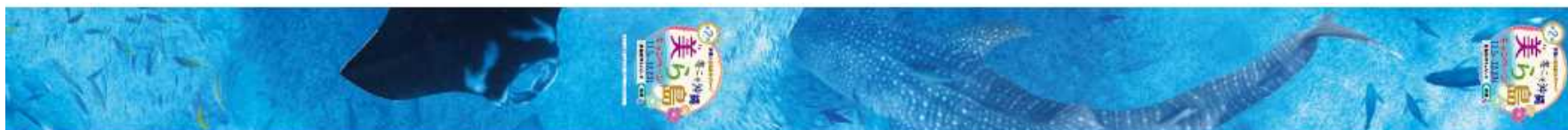
3. 八重山諸島車両 / 6. 「大人のふたり旅」車両