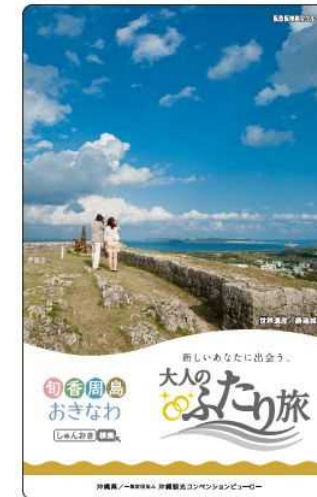
6. 「大人のふたり旅」車両