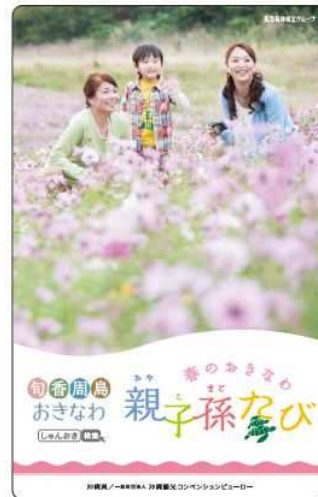
5. 「恋の島、沖縄」・ 「親子孫たび」車両