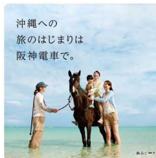
5. 「恋の島、沖縄」・ 「親子孫たび」車両