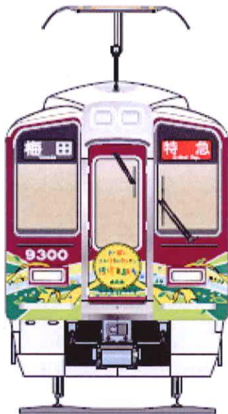
「カーボン・ニュートラル・トレイン 摂津市駅号」 正面