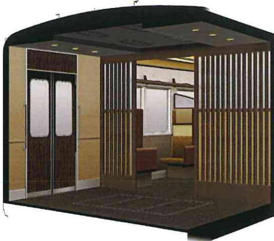
デッキ風車内エントランスのイメージ

客室への車内エントランスとして格子状の飾りを設け、デッキ風のデザインにしています。また、客室は半個室空間の演出を施したほか、「創作和紙ポスター」や座席背もたれの一部には畳を使用するなど京都の町家をイメージした内装にしています。