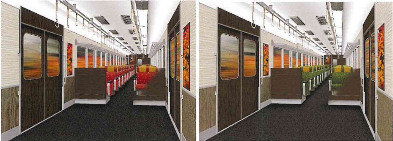
座席イメージ：蘭の華散らし（1・2号車）