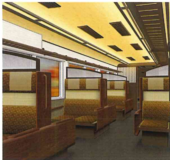
京町家をイメージした車内イメージ