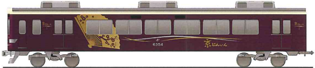
京とれいん (1号車) 外観イメージ