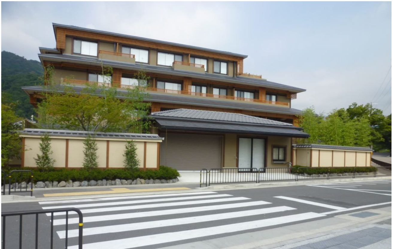
正面の建物がレンタサイクル営業所。後方建物はホテル「京都嵐山温泉 花伝抄」