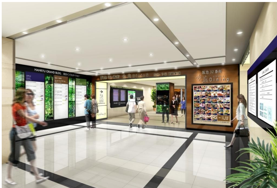
阪急グランドビル1階のエントランスロビーのイメージ