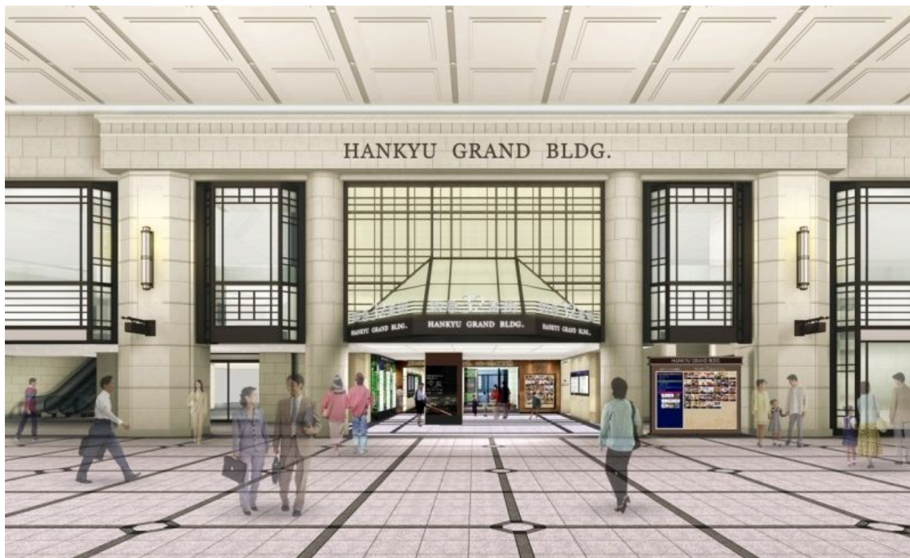
阪急グランドビル1階のエントランス部分のイメージ（阪急百貨店前コンコース側より臨む）