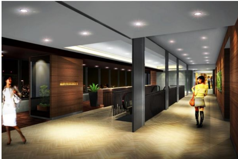
31階展望ホールのイメージ

上記のリニューアルは、本年5月上旬から7月中旬を予定しており、この間、全店舗の営業を休止させていただきます。具体的な休業期間やリニューアルオープン日などの情報は、確定次第ホームページでお知らせします。休業期間中は何かとご不便をお掛けしますが、新しく生まれ変わる「阪急32番街」にご期待ください。