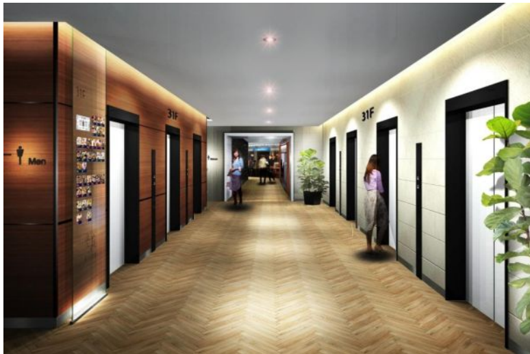
31階エレベーターホールのイメージ