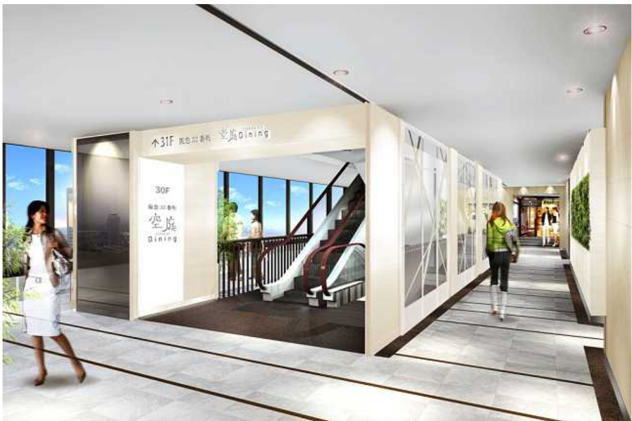
30階 共用部(イメージ)

阪急32番街「空庭ダイニング」の飲食・物販店では、このコンセプトのとおり、大空から街並みを見渡しながら、お食事やお買い物をお楽しみいただけます。さらに、各フロアの通路やエレベーター、エスカレーターホールなどを、落ち着いたあるモダンなデザインに一新し、洗練さと快適性を高めたほか、喫煙ルームの新設により一層の分煙にも努め、またトイレをリニューアルするなど、ホスピタリティのさらなる向上を実現しています。