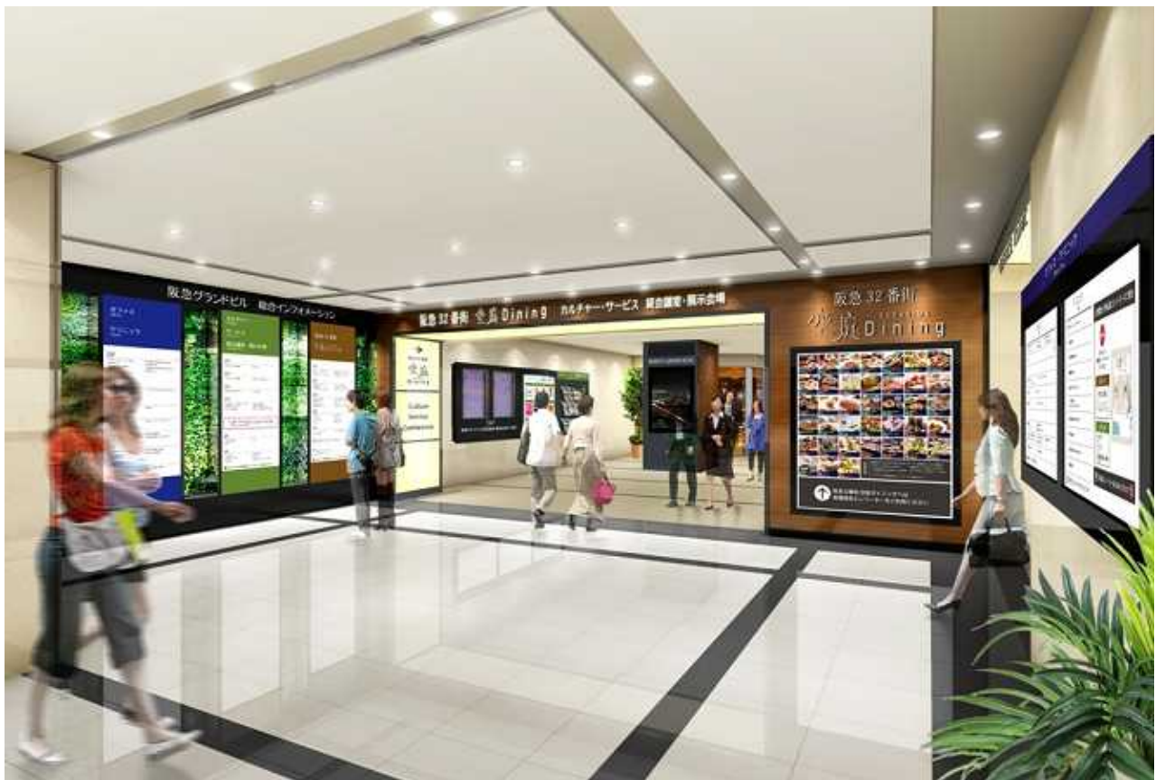
1階 エントランス(イメージ)