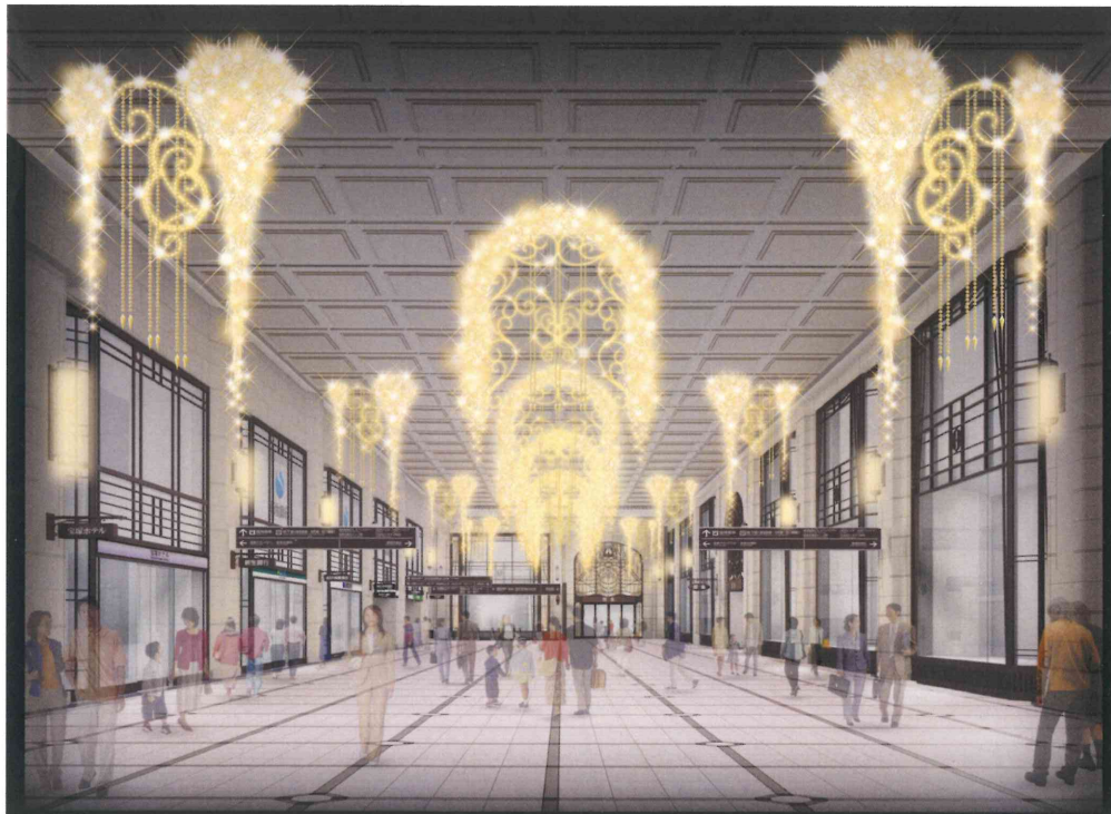
「フローティング・アーチ・クリスマス」イメージ

11月21日・23日と12月14日・24日は、クリスマスソングやゴスペルとともに特別点灯を実施