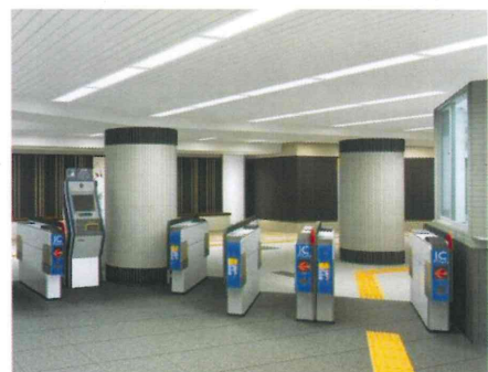
①改札口の内側より外側を望む（イメージ）