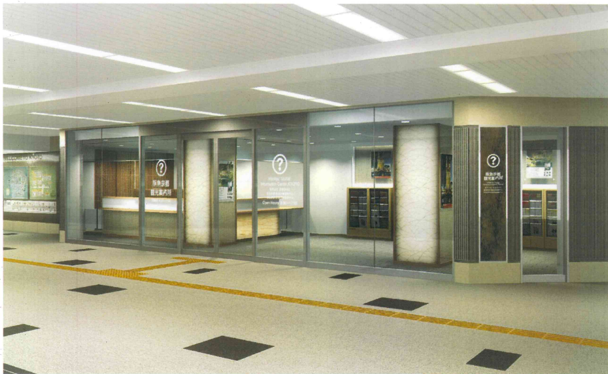
「阪急京都 観光案内所」(場所:河原町駅中央改札外) 外観イメージ