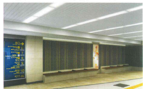
②改札口の外側スペース（イメージ）