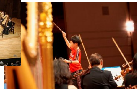
過去の指揮者体験の様子

この「阪急ゆめ・まち 親子チャリティコンサート」は、様々な事業を展開している当社の特色を活かして、最新の音響設備などをもち、オーケストラによるクラシックコンサートに対応可能な、梅田芸術劇場メインホール（大阪市北区）を会場として、音楽を通して子どもたちに「感動」を体験してもらえる機会を提供している取り組みで、今年で4回目の開催となります。