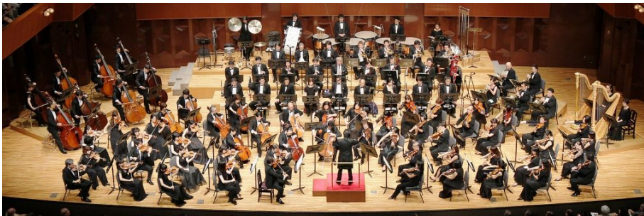
大阪フィルハーモニー交響楽団演奏の様子

阪急電鉄は、当社が所属する阪急阪神ホールディングスグループをあげて取り組む社会貢献活動「阪急阪神 未来のゆめ・まちプロジェクト」の一環として、「阪急ゆめ・まち 親子チャリティコンサート」を開催します。