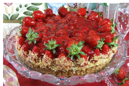
「ミヤムミヤム」商品イメージ