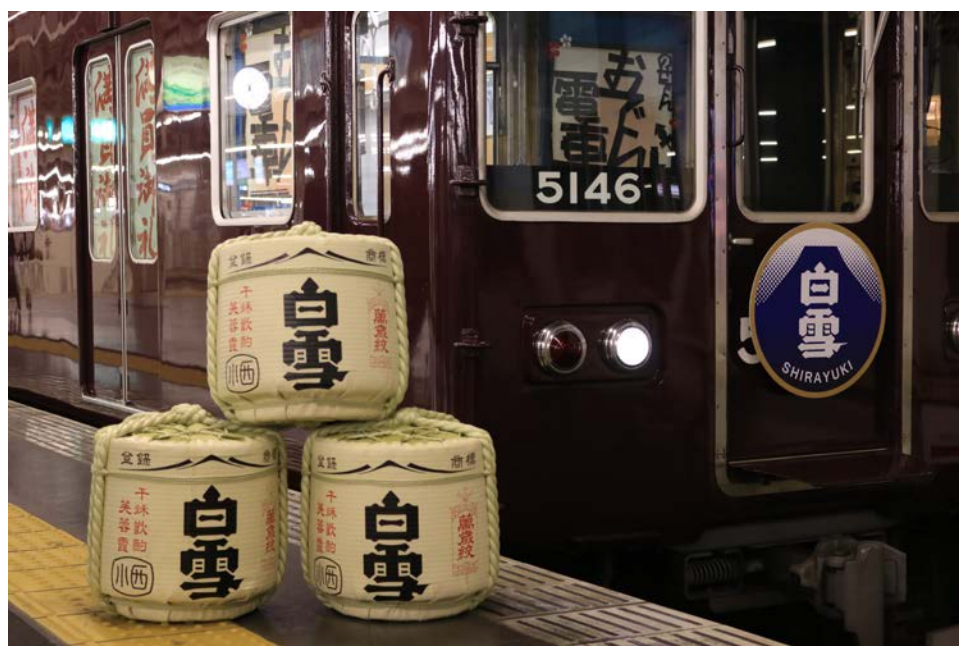
白雪のヘッドマークを付けた5100系「のせでんおでん電車」(2017年2月)

TEL : 072-792-7200 FAX : 072-792-7760 (平日・9:00~17:30)