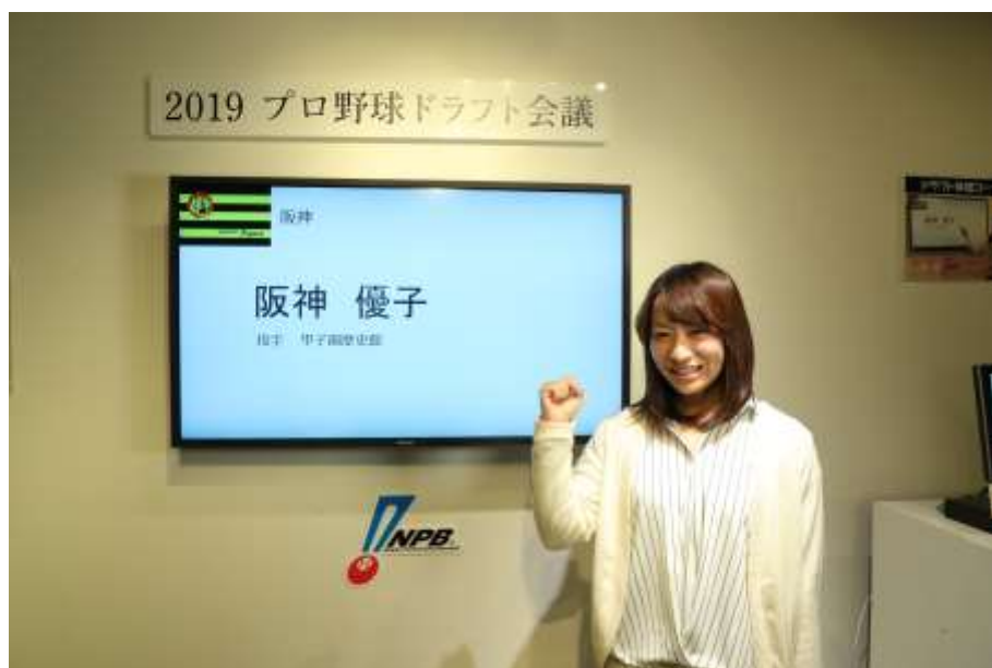
ドラフト体感画面イメージ