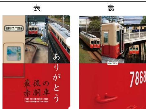
(1) ありがとう赤胴車クリアファイル